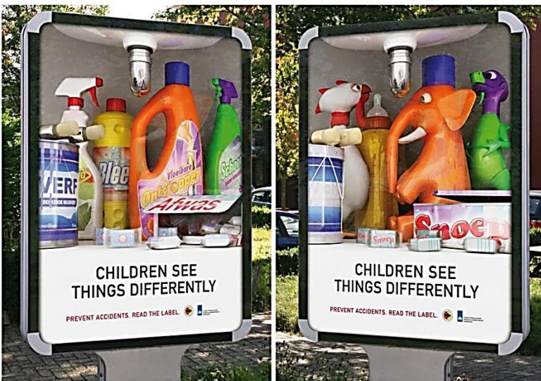
The ad shows two different images when viewed from different angles (lenticular effect).